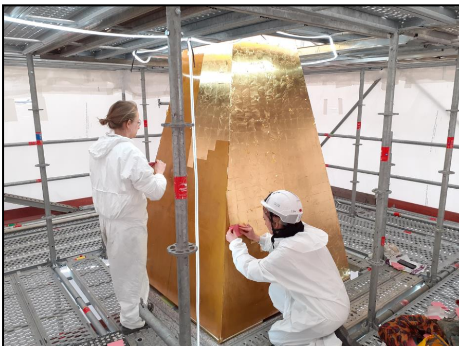
Pose des feuilles d'or sur le pyramidion lors de l'opération de restauration en 2022 par les ateliers Gohard.

Pendant les opérations de restauration, le pyramidion en bronze sur une structure en acier recouvert d'or, posé en 1998 et créé par Étienne Poncelet, architecte en chef des monuments historiques (ACMH), a été complètement redoré à la feuille d'or par l'entreprise Gohard, lui rendant son éclat d'origine, et à l'obélisque celui de son image de rayon de soleil pétrifié, gloire à Ramsès II.