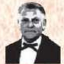
Maison Louis Carré